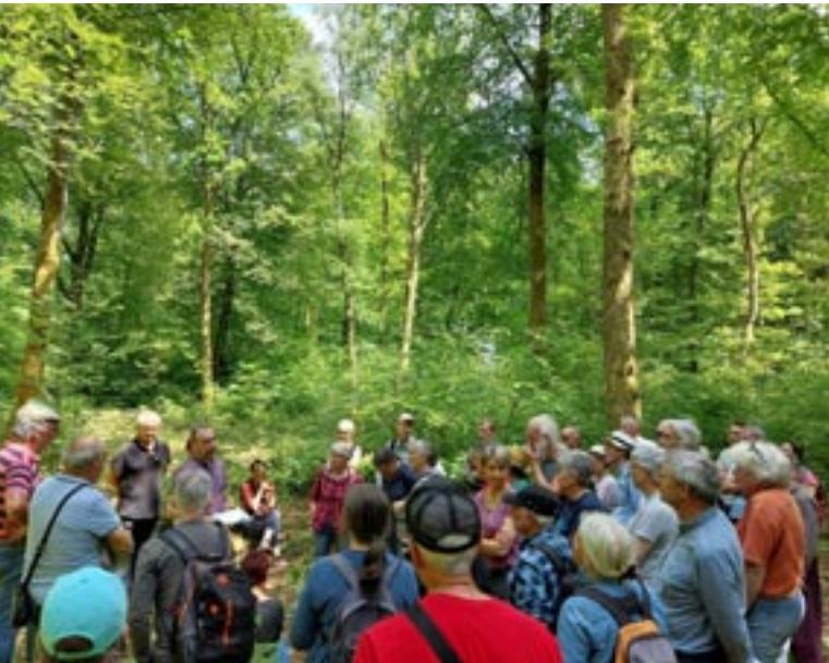
Réunion annuelle du groupement forestier : visite de la forêt du « Bois du Cul-de-sac ».

Il y a des termes et des mots qui sont faits pour endormir le citoyen : gestion « raisonnée », « durable »... De quoi se plaint-on ? on plante un arbre, c'est « durable ». Il nous revient alors, à nous défenseurs de la forêt, de communiquer, d'expliquer que la dégradation visible du paysage n'est que la partie émergée de l'iceberg d'une exploitation intensive. Le plus grave ne se voit pas immédiatement : la destruction de la biodiversité, l'impact sur l'eau, l'appauvrissement des sols, sans oublier les gaz à effet de serre qui ne seront pas captés, vu que les arbres, véritables réservoirs de carbone, ont été coupés.