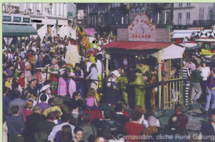
Carnavallon, cliché René Gillung

En 2005, la ville a fêté la 12 e édition de son Carnavallon. C'est désormais une tradition, chaque année Avallon fête Carnaval sous une pluie de confettis. La manifestation est organisée par l'Union commerciale, les Vitrines d'Avallon, en partenariat avec la municipalité. Cette fête annonçant le printemps est, le temps d'un week-end, l'occasion de se déguiser pour les commerçants et tous les Avallonnais.