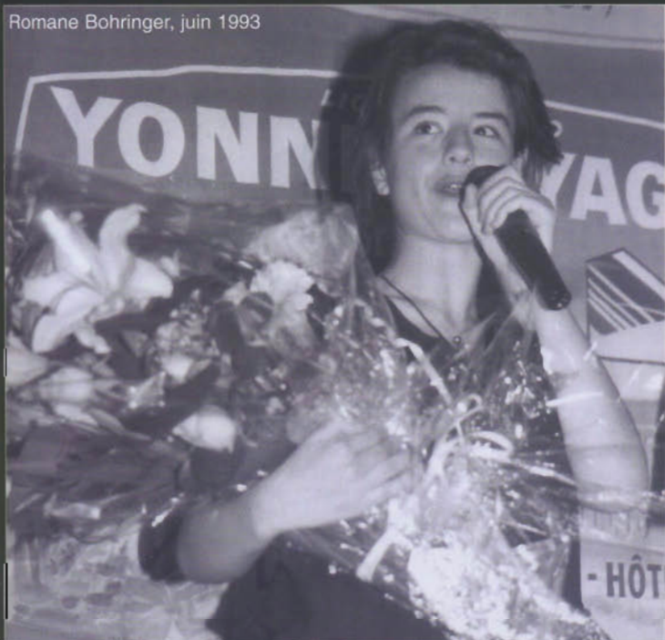
Romane Bohringer, juin 1993