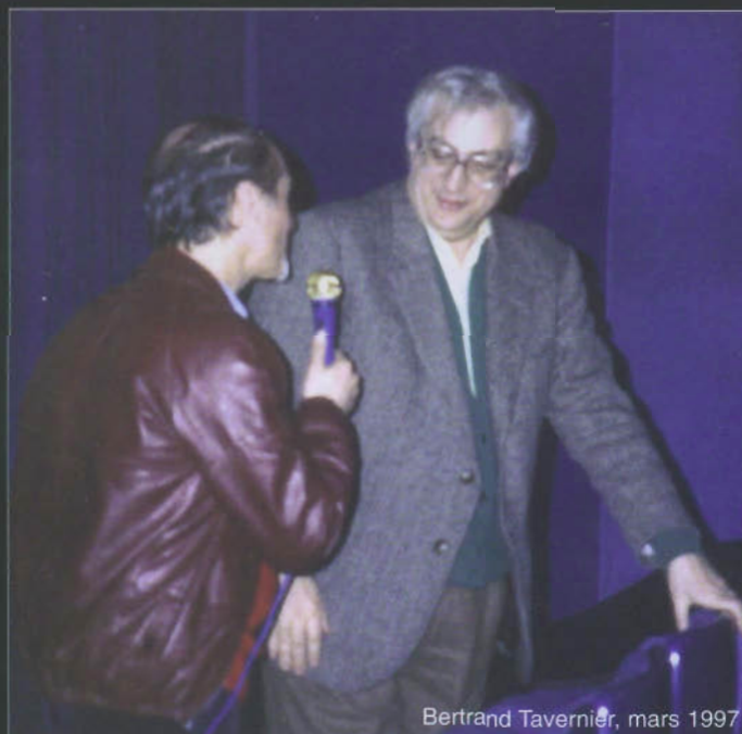
Bertrand Tavernier, mars 1997