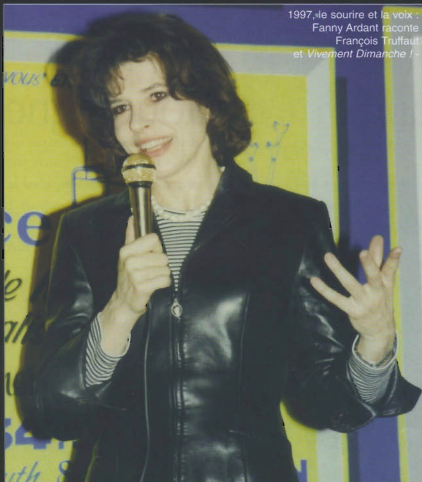
1997, le sourire et la voix : Fanny Ardant raconte François Truffaut et Vivement Dimanche ! -