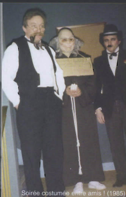
Soirée costumée entre amis ! (1985)