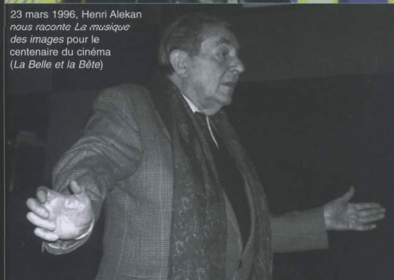
23 mars 1996, Henri Alekan nous raconte La musique des images pour le centenaire du cinéma ( La Belle et la Bête )