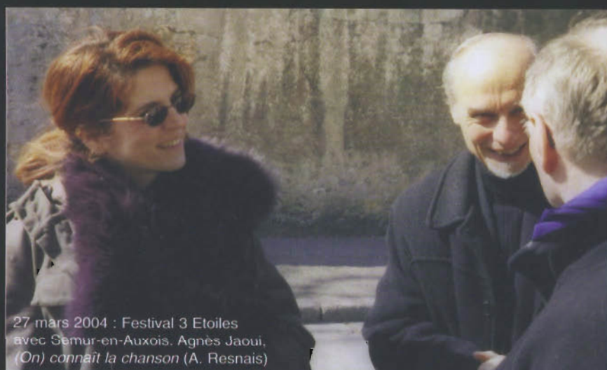
27 mars 2004 : Festival 3 Etoiles avec Semur-en-Auxois, Agnès Jaoui, (On) connaît la chanson (A. Resnais)