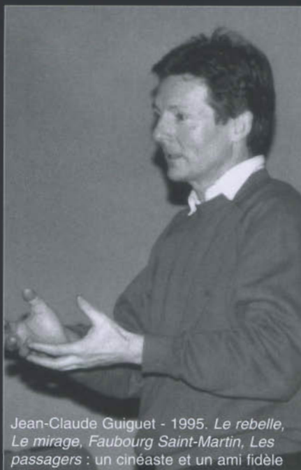
Jean-Claude Guiguet - 1995. Le rebelle, Le mirage, Faubourg Saint-Martin, Les passagers : un cinéaste et un ami fidèle