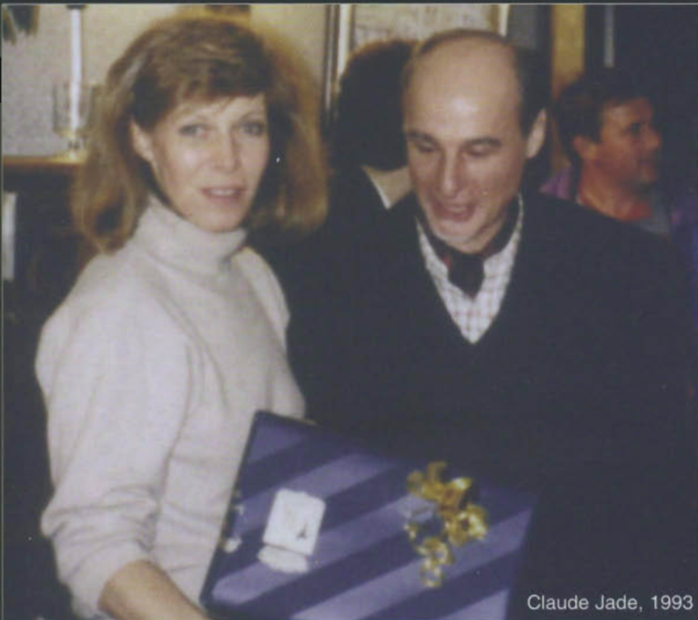
Claude Jade, 1993