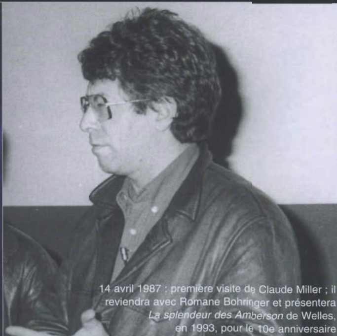
14 avril 1987 : première visite de Claude Miller ; il reviendra avec Romane Bohringer et présentera La splendeur des Amberson de Welles, en 1993, pour le 10e anniversaire

En dehors de cette journée, le programme du ciné-club fut une nouvelle fois dense et varié, même si l'on peut toujours contester tel ou tel choix parfois imposé par des impondérables de dernière minute.