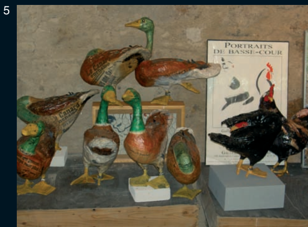
1 - Passage autour du Dolmen : Guy Gervis, 2 - Arche au dessus de l'Arroux (maquette) : Guy Gervis, 3 - Jaune acrylique : Miriam Stern, 4 - Sans titre : Meg Ryan, 5 - Poules et canards - Chantal Dunoyer, 6 - Poisson : Marga gervis, 7 - Ombre : Agnès Niehorster, 8 - Passage bleu : Miriam Stern, 9 (de gauche à droite) : La première lettre mondiale, Carré jaune, Paysage imaginaire.