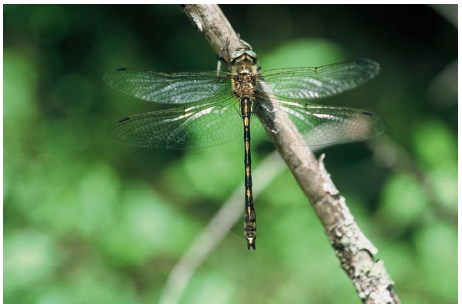
▲ Cordulia à corps fin

Pour mettre en œuvre cette politique novatrice de conservation de la biodiversité, la France a choisi une démarche concertée et basée sur le volontariat. Ainsi, pour chaque site un comité de pilotage est mis en place et présidé par un élu du site. Ce comité de pilotage est composé par des représentants des différents acteurs locaux et les administrations concernées (syndicats de propriétaires forestiers, associations de protection de la nature et DDAF par exemple), au total c'est près d'une cinquantaine de personnes qui est conviée pour chaque réunion.