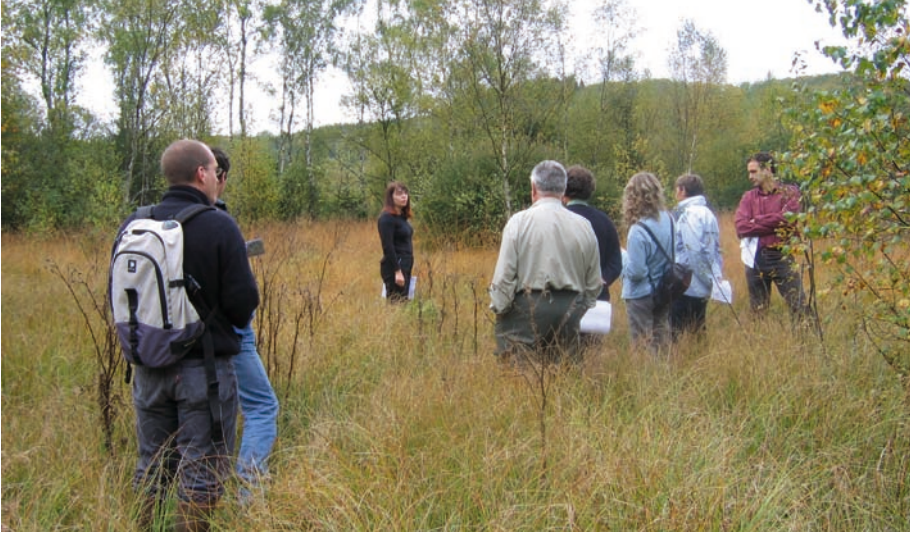
▲ Visite du comité de pilotage sur la tourbière du Vernay à Saint-Brissson

régional du Morvan est concerné par onze sites, soit environ 7 300 hectares, ce qui représente 2,5% du territoire du Parc.