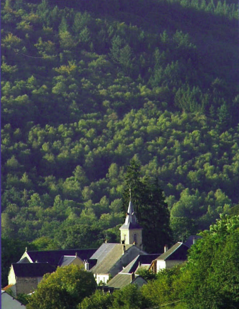
Saint-Prix, petit village du sud Morvan ▲

Tous les ans au printemps, une grande fête de la randonnée «la Galipotote» est attendue avec impatience par marcheurs et vététistes qui trouvent facilement à se loger dans les différents gîtes situés sur la commune.