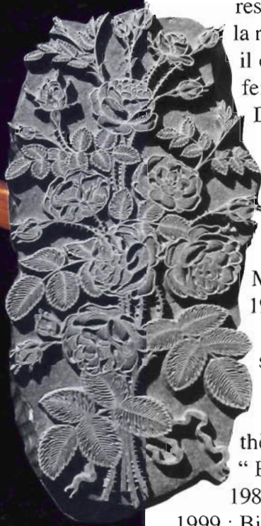
Les roses de REDOUTÉ

dessin, la linogravure, la xylogravure et la mise en page. En 1964, il commence sa carrière de relieur-doreur à la bibliothèque municipale d'Annecy. Il passe ensuite une année aux établissements Houdard à Paris, puis une autre année et demie à la Bibliothèque nationale comme restaurateur. En 1989, il est reçu premier au concours de restaurateur spécialiste des Archives de France, spécialité dorure. Il choisira de rentrer au Service historique de la Marine à Vincennes où il est également reçu et devient chef de l'atelier de reliure contemporaine, de dorure, de restauration de livres anciens. Il est chargé de la formation à la restauration de reliure et dorure. En 1994, il est expert de la vente de la collection de fers à dorer de l'atelier Mercher à l'hôtel Drouot et en rédige le catalogue.