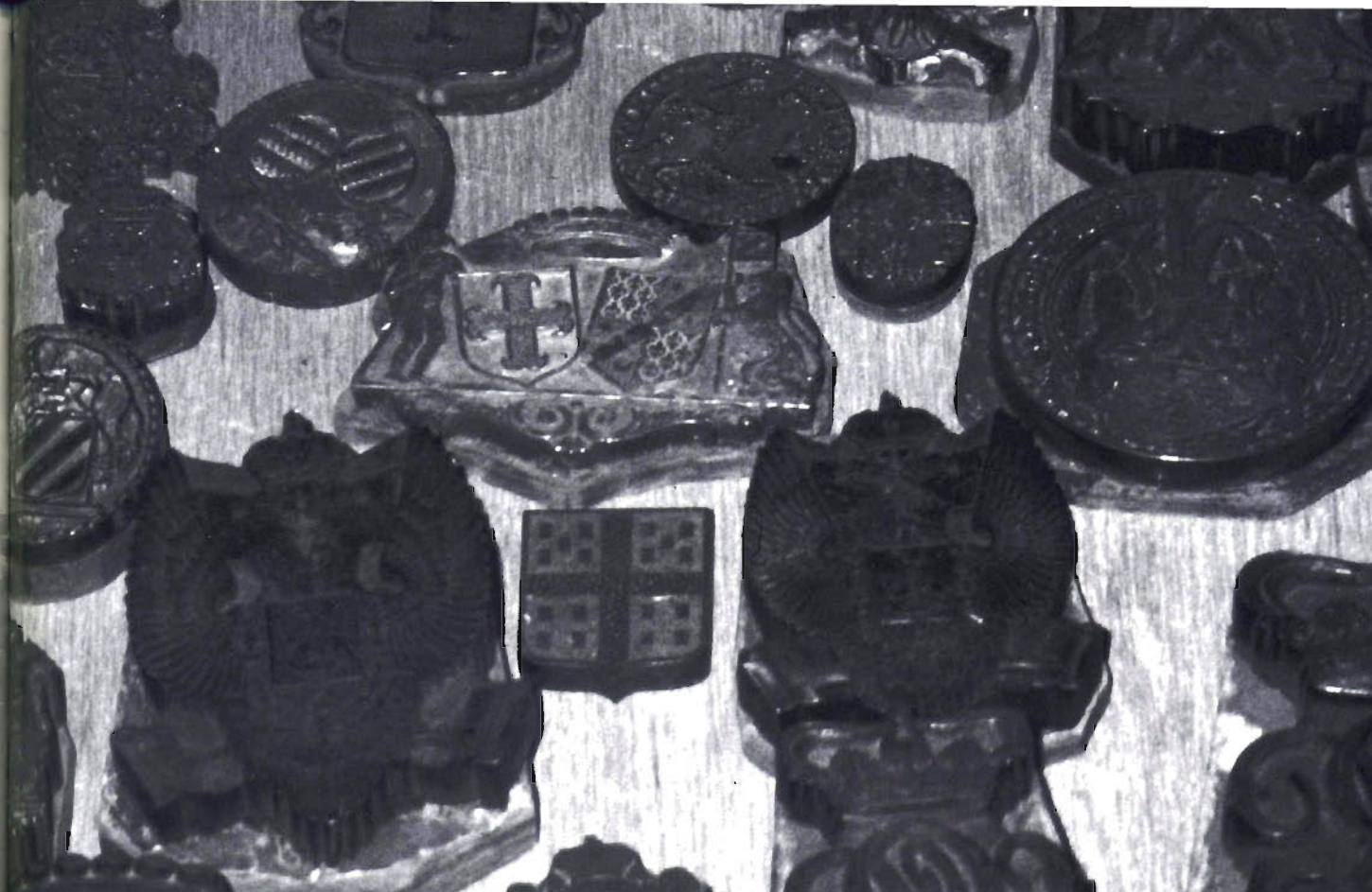
quelques fers à dorer