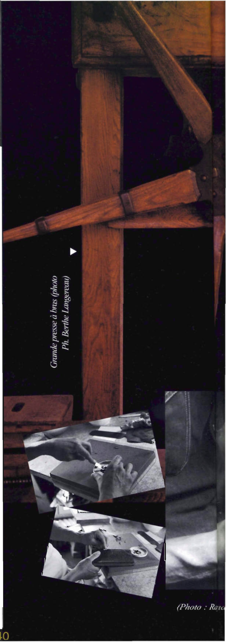
Grande presse à bras

chef d'atelier de reliure au Service historique de la Marine nationale au château de Vincennes, est né à Paris en 1962. Elève de l'école Estienne, il apprend la reliure, la dorure, la maquette de reliure, le