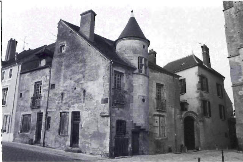
▲ Maison des Sires de Domecy