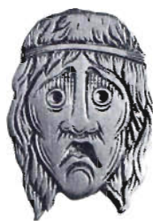
Fer à dorer

Notre patrimoine bibliographique est largement éparpillé à travers le monde, tandis que dans la plupart des pays, les métiers du livre sont complètement absents ou de qualité moyenne.