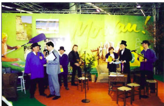
▲ Stand du Morvan au Salon Loisiroscope à Dijon