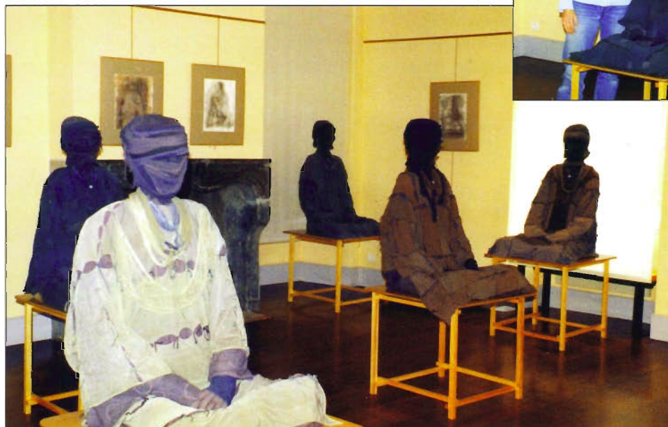
▲ Une partie de cette exposition des "Printanières"