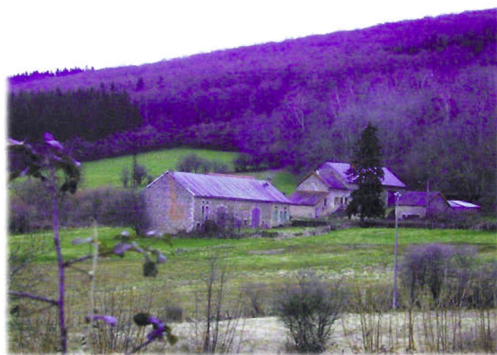
Le centre d'Art Contemporain du Meix Roblin.

L'aménagement des espaces s'effectuera par tranches, sur cinq, dix ans.