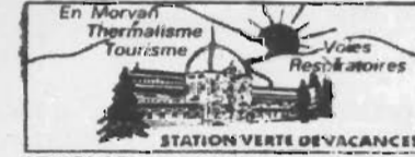
ST HONORE LES BAINS 18-8-94