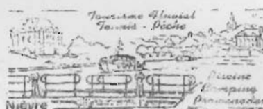
CHATILLON EN BAZOIS 9-5-00