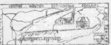
TANG SUR ARROUX 15-5-95