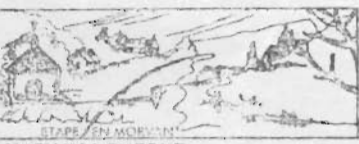
GENAY L'EVEQUE 4-4-00