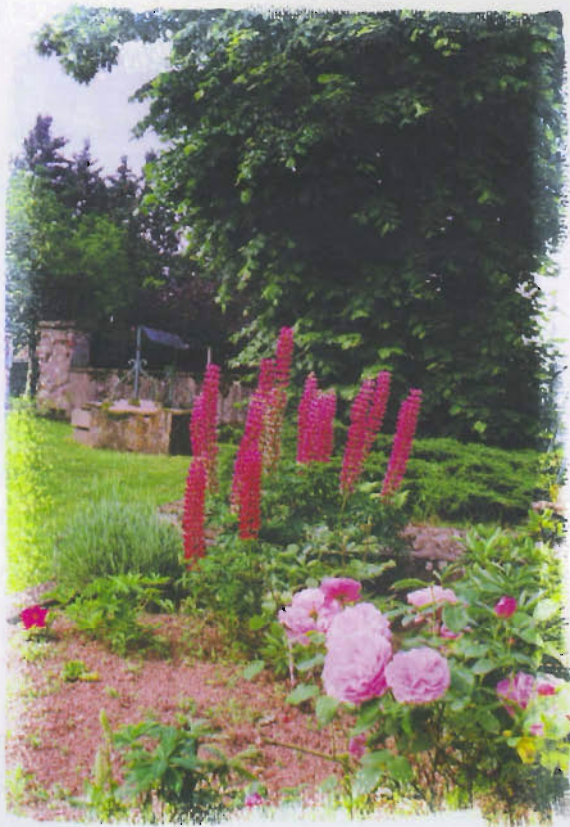
L'escargot croit ici, dans un environnement floral qui met en appétit... le visiteur

communication avec leurs congénères qui sont de l'autre côté frontalier d'un parc de 500 mètres carrés. Effet de serre? Trop grande concentration d'individus? Ou tout simplement instinct grégaire? Mais le maître des lieux veille!