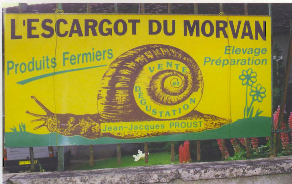
Une affiche qui rappelle curieusement l'âge d'or de l'affichage agricole...

Une référence sur laquelle il s'appuie pour imposer la qualité d'élevage et celle de la préparation culinaire : la farce.