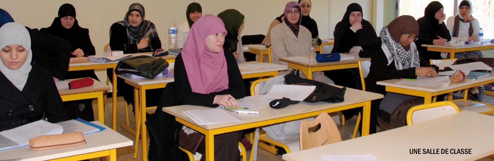
UNE SALLE DE CLASSE