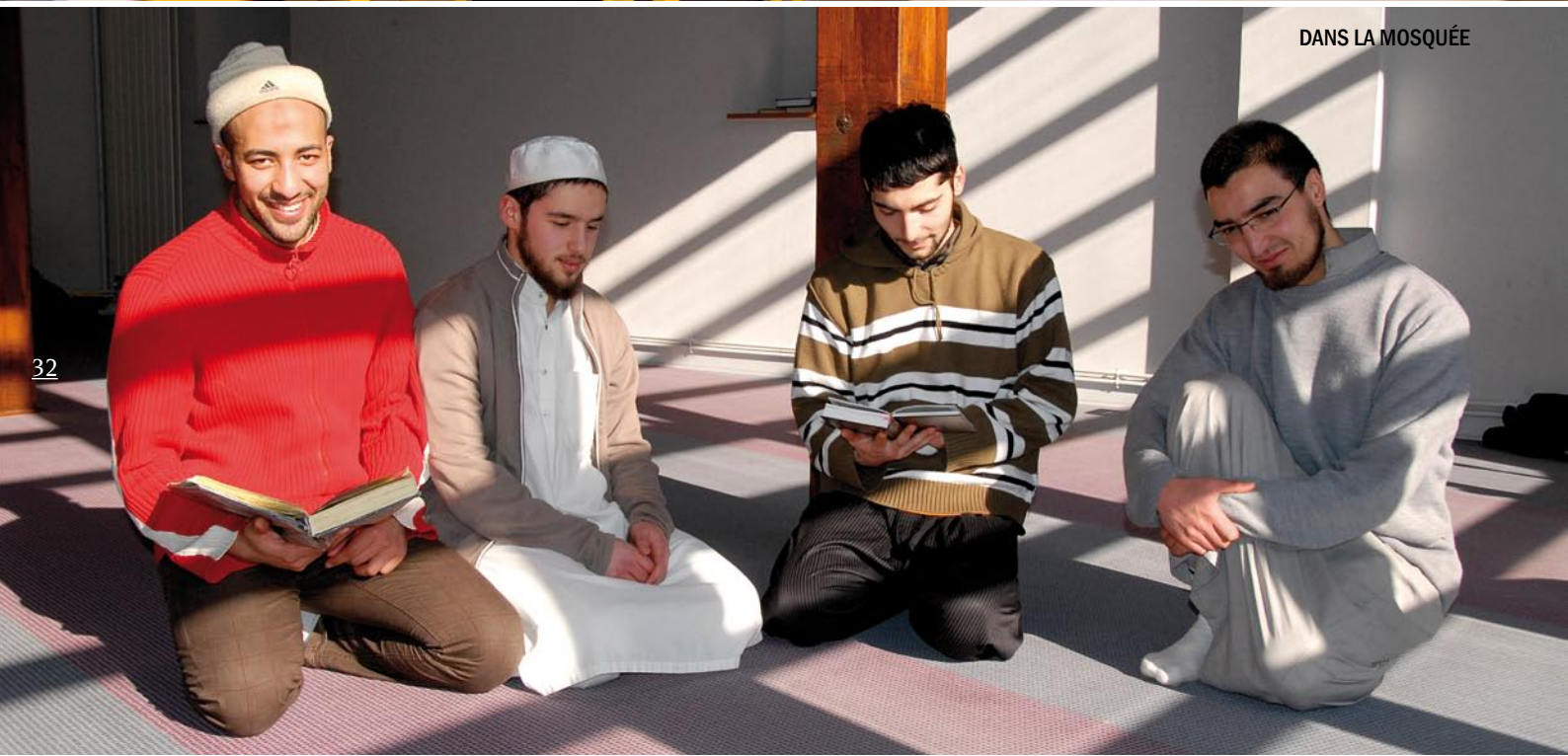
DANS LA MOSQUÉE