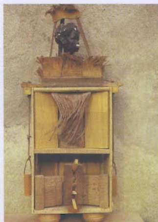
Rio negro - bois, cuivre, plâtre