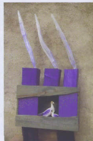
Le voyage en mer - assemblage