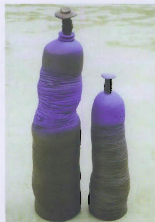
Les encordés - faïence engobée