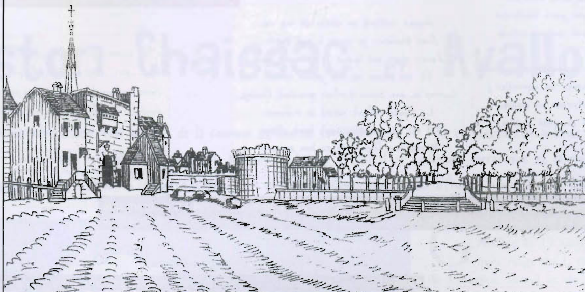
LE COURS ET LA GRANDE PORTE (1750)

L'actuel place Vautran telle qu'on pouvait la voir sous la révolution. « Avallon ancien et moderne » de A.Heurley 1880