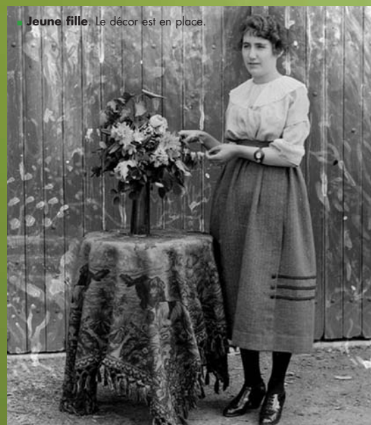
■ Jeune fille. Le décor est en place.

Les plaques au gelatino bromure d'argent, ont été numérisées pour pouvoir ensuite présenter les tirages lors de différentes expositions à la poste d'Anost. Ces plaques datant des années 1920-1930 sont le témoignage d'une époque. Notre menuisier aimait jouer au vrai photographe et installait parfois drap de fond et guéridon pour immortaliser les poses. La prise de vue demandant pour le sujet une certaine immobilité, il n'est pas rare, particulièrement, dans les groupes d'apercevoir le visage flou de celui qui n'a pu résister à l'envie de bouger.