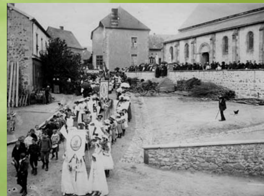
■ Procession devant l'église.

Toutes les photos sont prises en extérieur. La façade de "l'épicerie Billon" et de la maison du "Titi" servent souvent de décors, mais "le René" se déplace et les prises de vue ont lieu parfois chez les "modèles".