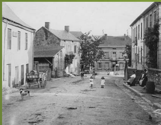
■ Rue principale d'Anost. Une voiture à âne est arrêtée devant l'atelier du menuisier.