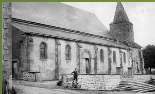
■ L'Église et son ancien clocher.