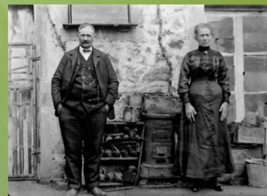
■ Couple de Morvandiaux devant chez lui.