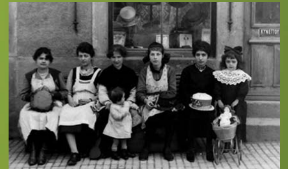
■ Modiste. Quand l'épicerie Billon était atelier de modiste.

"La municipalité d'Anost m'a fait un très grand honneur et je lui en exprime toute ma gratitude, en m'invitant à prononcer quelques paroles à la mémoire des 166 enfants d'Anost, mes compatriotes et mes camarades de combat qui sont tombés dans la grande guerre pour la défense de la France, de la liberté et du droit. (...) Ils avaient respiré l'air que nous respirons, suivi nos chemins tortueux, parcouru nos bois, pêché dans nos ruisseaux, travaillé cette terre morvandelle, attachante et rude. Ils étaient nôtres. Et maintenant ce sont eux qui sont inscrits là..."