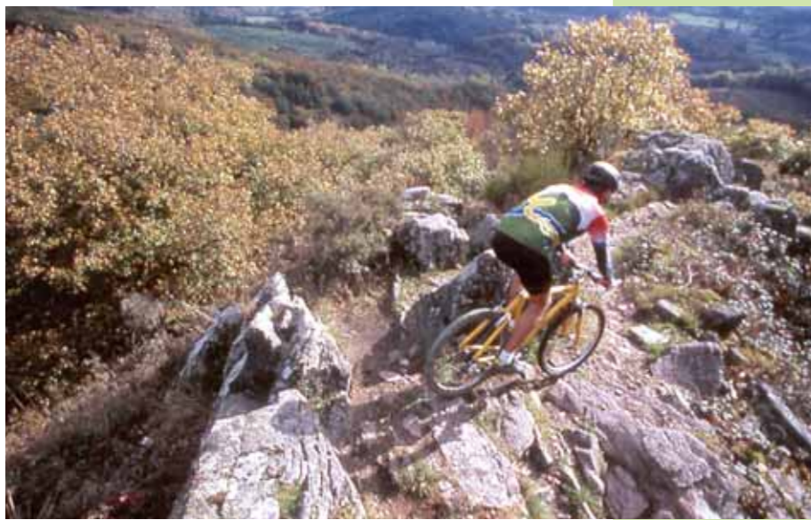
Les randonneurs, qu'ils se déplacent à pied, en VTT ou à cheval, représentent la clientèle habituelle des gîtes d'étape ▲

Après avoir présenté, dans son numéro treize, deux gîtes ruraux – la Ferme des Groseilles à proximité de Saulieu et la Grande Sauve à Moulins-Engilbert – l'équipe de Vents du Morvan a souhaité poursuivre l'enquête sur l'hébergement touristique en Morvan. Dans ce vingtième numéro, nous avons, plus particulièrement, voulu porter notre attention sur l'accueil en gîtes d'étape et de séjour. Nous avons rapidement constaté que les professionnels de cette filière d'activité disposent d'un collectif déjà bien organisé : l'association Morvan Rando-Accueil.