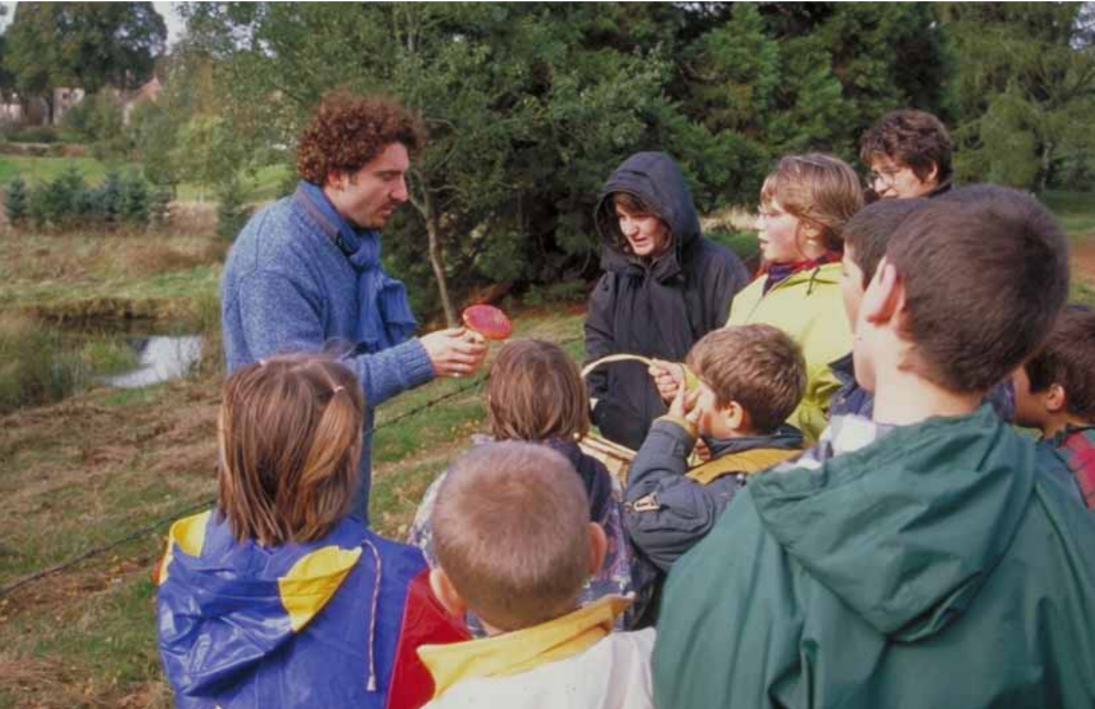
▲ Les gîtes d'étape sont des hébergements adaptés pour les classes vertes. Toutefois, la fréquentation de ce type de clientèle est à la baisse depuis quelques années.

voir dans cette dernière évolution, l'impact de la communication du territoire du Morvan lors de salons touristiques majeurs comme Loisiroscope à Dijon ou le salon du Tourisme à Troyes.