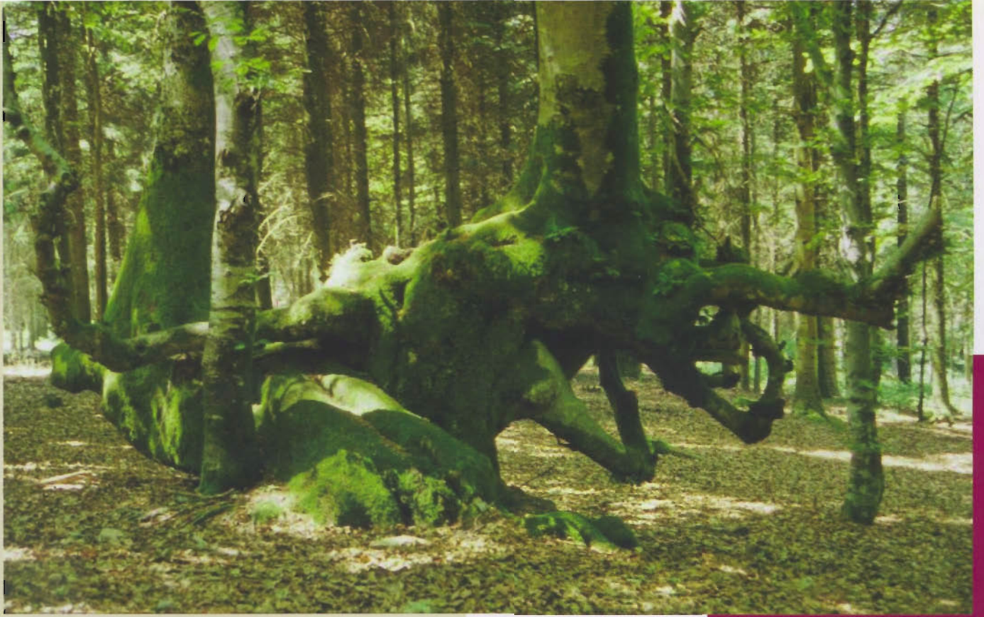
▲ Exemple de "queules" tortueuses du Mont-Beuvray

donne aujourd'hui les "queules" tortueuses du Mont-Beuvray (cf. ci-dessus)