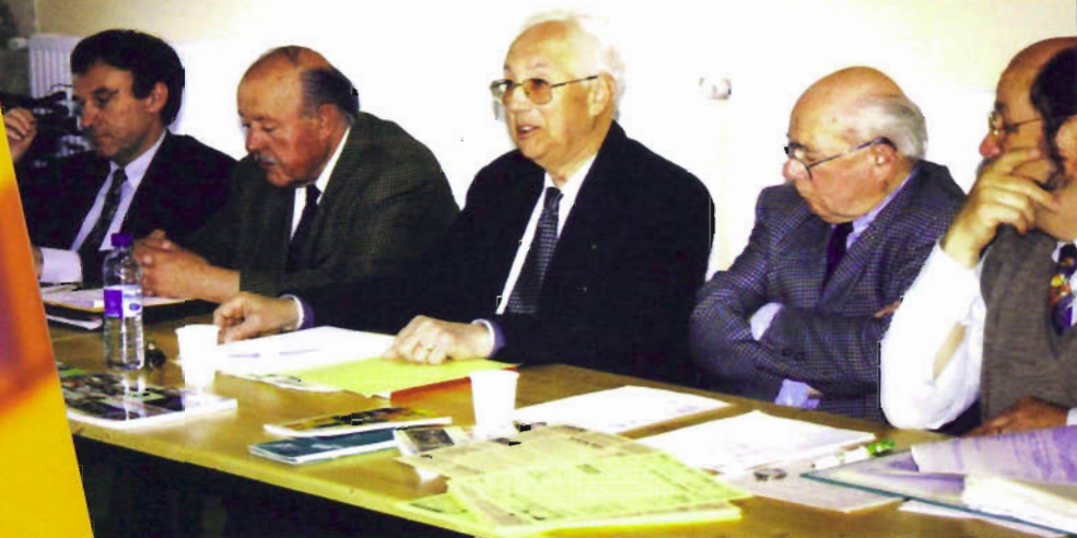
Les responsables de l'ATM au travail

nouveau son action. De nouveaux objectifs sont fixés tels que la promotion collective de fêtes et de manifestations, le désenclavement ferroviaire et routier du Morvan, le soutien logistique à la littérature morvandelle, et l'allongement de la saison touristique.