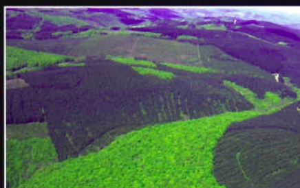
Arleuf (58) - Paysage forestier