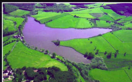
Saint-Léger-sous-Beuvray (71) Etang de Poisson