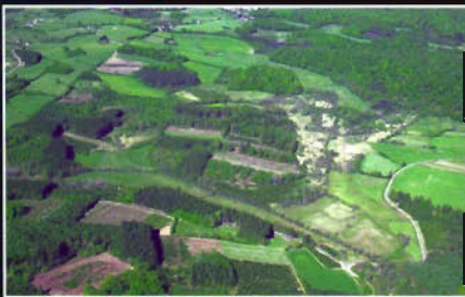
Brassy (58) - Prairie de Vaucorniau Zone Natura 2000