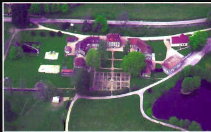
Saint-Brisson (58) Espace Saint-Brisson