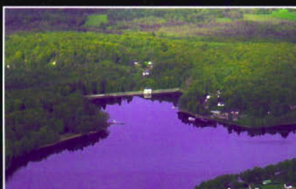
Montsauches-les-Settons (58) - le barrage