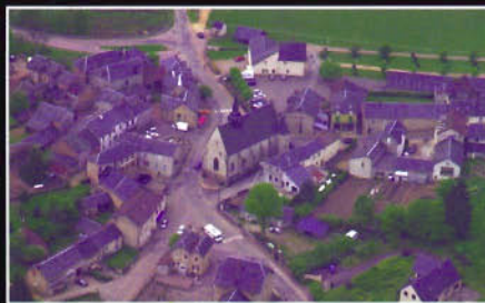
Moux (58) - L'église