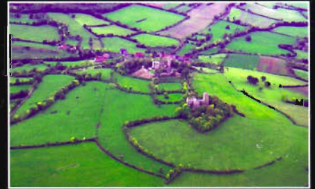
Vic-sous-Thil (21) - La Butte de Thil