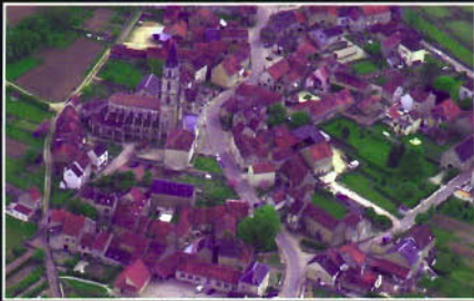
Saint-Père-sous-Vézelay (89) - Le bourg