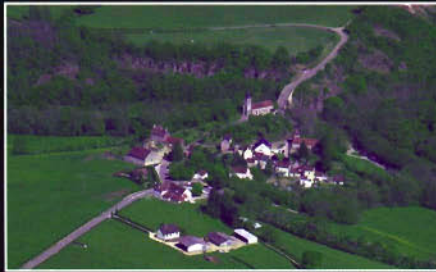
Pierre-Perthuis (89) - Les deux ponts