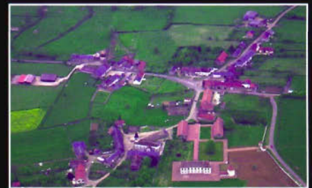
Vianges (21) - Le bourg