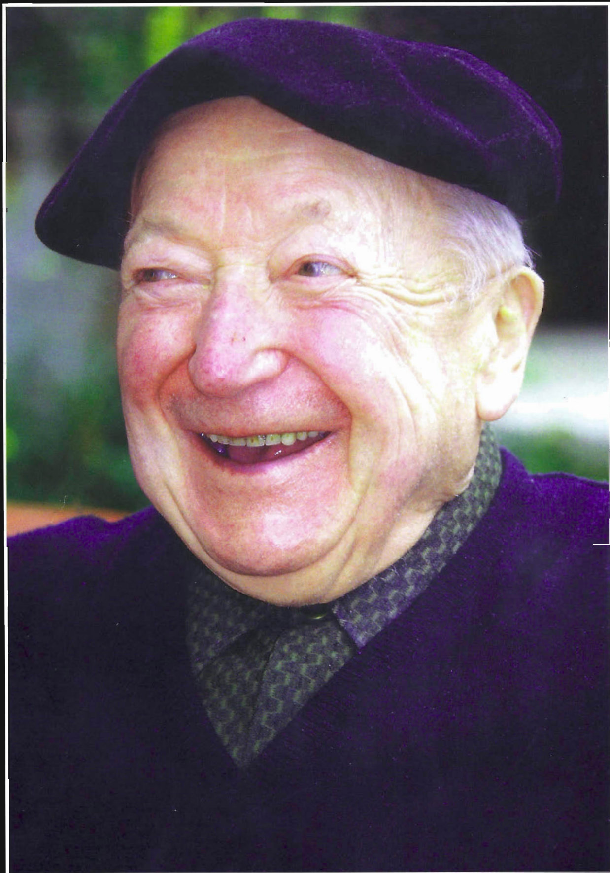
Portrait de Marcel Bigeard, " Le Mécanique " Anost, 7 décembre 2002.