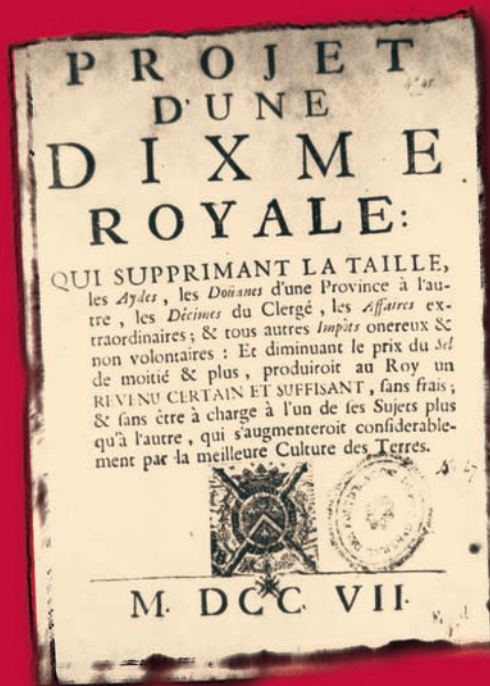
▲ Projet d'une Dime Royale.

Toujours soucieux de noter ses pensées, Vauban écrira un mémoire intitulé : “ Idée de l'éducation que je voudrais donner à mes petits garçons ”. Il y rédige un programme complet des études à suivre, de l'entraînement sportif à pratiquer, des jeux éducatifs... Il